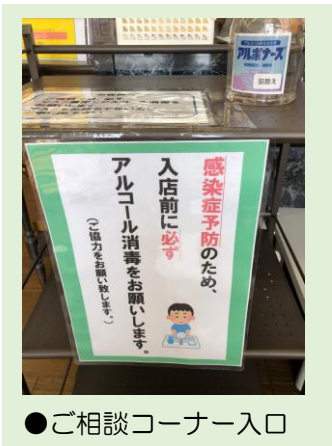
●ご相談コーナー入口